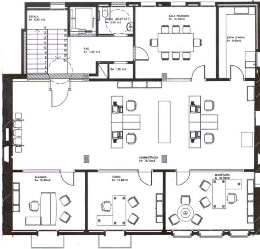
PLANTA PRIMERA E:1/100