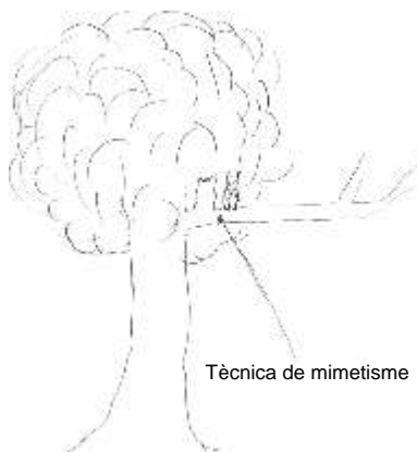
Tècnica de mimetisme

CURIOSITATS: El xot utilitza la tècnica del mimetisme per passar desapercebut, tant pel seu color (entre gris i marró) com per la seva forma, doncs, en ocasions imiten branques i troncs trencats. Té unes plomes a sobre del cap que semblen orelles i que ajuden a semblar un tronc esqueixat; aquestes plomes també reflecteixen l'estat d'ànim.