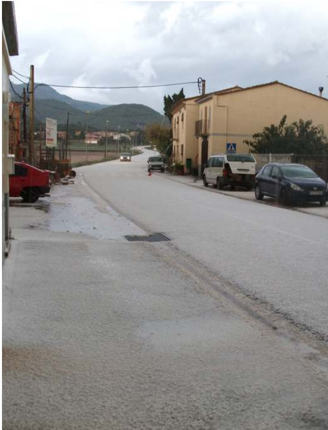
Així va quedar en pocs moments el centre de Canet, un vegada passada la fortíssima pedregada que va caure i que va fer força mal als arbres i a l'agricultura.