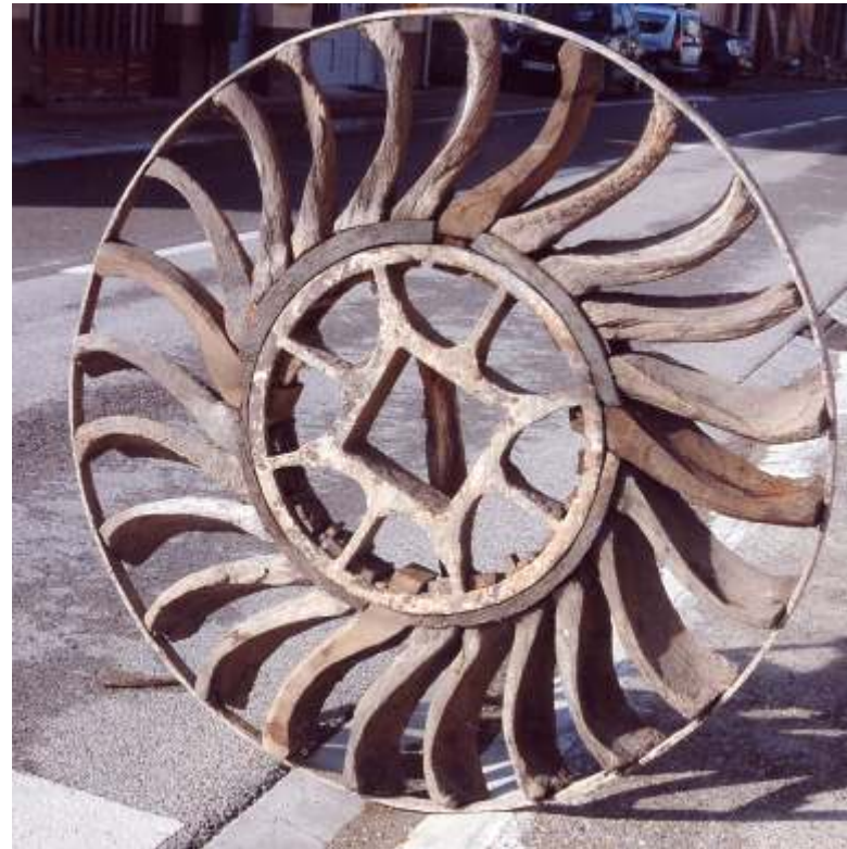
Aquesta turbina de molí, té més de dos-cents anys. Era la roda que movia l'eix del Molí d'en Gelador, se suposa que el més vell de la riera. Té un diàmetre de quasi dos metres i les pales són de fusta de roure, fetes a mà. El molí fa més de quaranta anys que va desaparèixer.