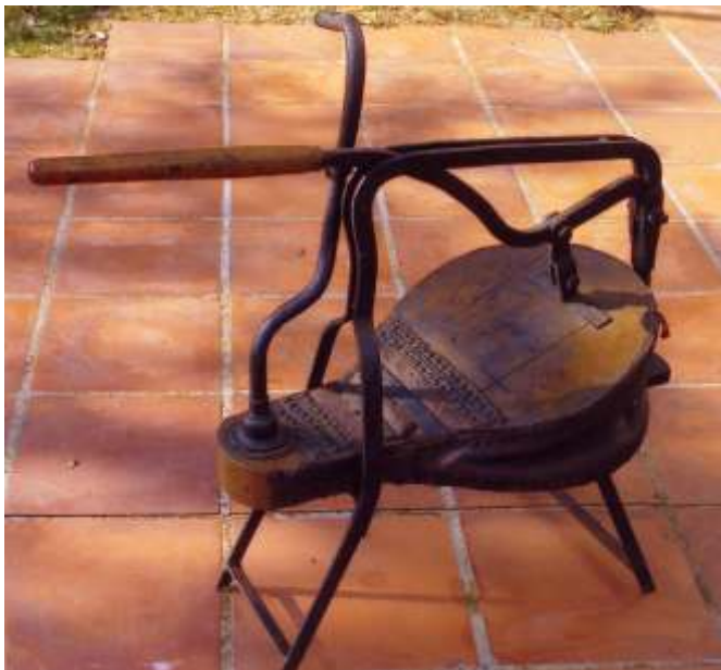
Eines Curioses A primera vista molts no endevinaran perquè serveix aquesta màquina que té molt més d'un segle. És un bufador, un BUFABOTS, servia per bufar els bots de transport que es guardaven al magatzem, abans d'omplir-los de vi.